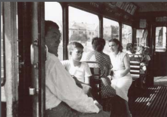
Boedapest, omstreeks 1958

De tekst op pagina 3 verscheen eerder in Tsjerkefinster, de teksten op pagina 5, 15 en 21 verschenen in Terpnijs, de tekst op pagina 11 verscheen in Student en de tekst op pagina 59 in De Rode Leeuw. De tekst op pagina 29 is niet eerder gepubliceerd. De foto op pagina 4 is van Félix-Jacques Antoine Moulin, de foto's op pagina 63 en 64 zijn gemaakt door Pieter Bakker sr. en de foto's op pagina 10 en 14 zijn van onbekende fotografen. Alle andere foto's zijn van de auteur.