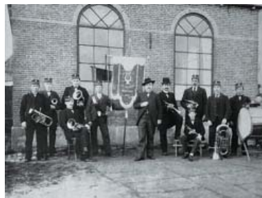
Leden van Excelsior op het schoolplein achter de oude school waarschijnlijk aan het begin van de vorige eeuw. Op het vaandel staat het jaartal 1900.

Excelsior is van grote betekenis geweest in het leven van vele Schraarders en van vele leden uit dorpen en steden in de wijde om- trek. Terwijl het verenigingsleven in onze tijd overal op zijn retour is, blijft het muziekkorps alleen maar groeien en bloei- en. De grote inzet die van de musici wordt gevraagd, blijkt voor niemand een belemmering te zijn. In het licht van de veranderende tijdgeest is dat iets bijzon- ders. Op dit moment repeteert het orkest vanwege het besmettingsgevaar in de open lucht. Door de wind meegevoerde koperklanken zorgen in het dorp voor een feestelijke zomeravondstemming.