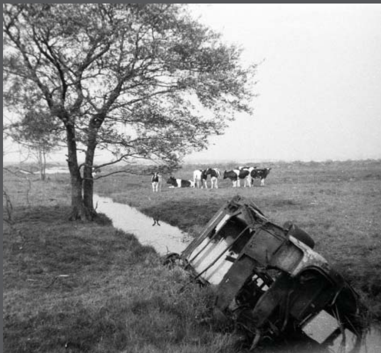
Waver, omstreeks 1973