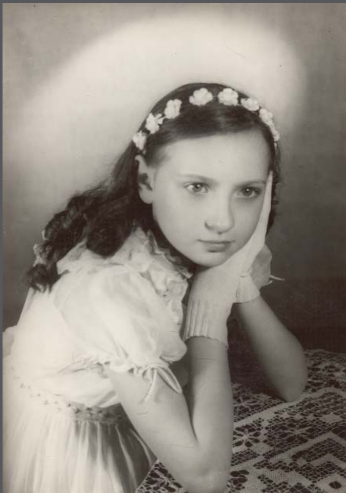
Boedapest, jaartal onbekend