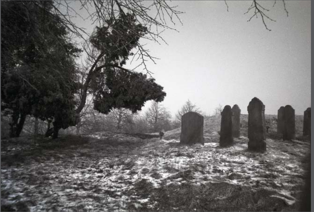
Oud Beets, 1987