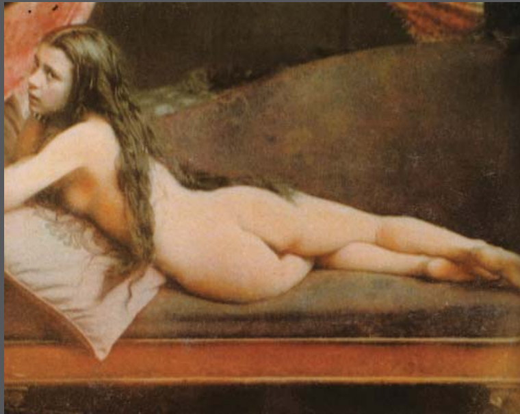
Kleurendaguerrotype van Félix-Jacques Antoine Moulin uit omstreeks 1851–1854