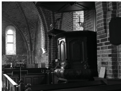
De preekstoel van de hervormde kerk van Ulrum, 2022