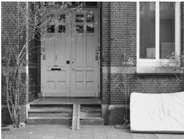
De ingang van Rapenburg 51 met rechts het lokaal van de eerste klas, 2013

Vaste rots van mijn behoud, als de zonde mij benauwt, laat mij steunen op uw trouw, laat mij rusten in uw schouw, waar het bloed door U gestort, mij de bron des levens wordt.